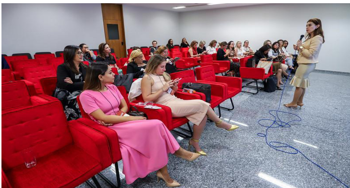
Imagem 10 - Oficinas com a participação de integrantes do Núcleo na 2ª edição do evento entre os dias 30 e 31 de agosto de 2023

Fonte: SILVEIRA. Luiz. Agência CNJ. Disponível em: https://www.flickr.com/photos/cnj_oficial/albums/72177720310873618/ . Acesso em: 22 nov. 2024.