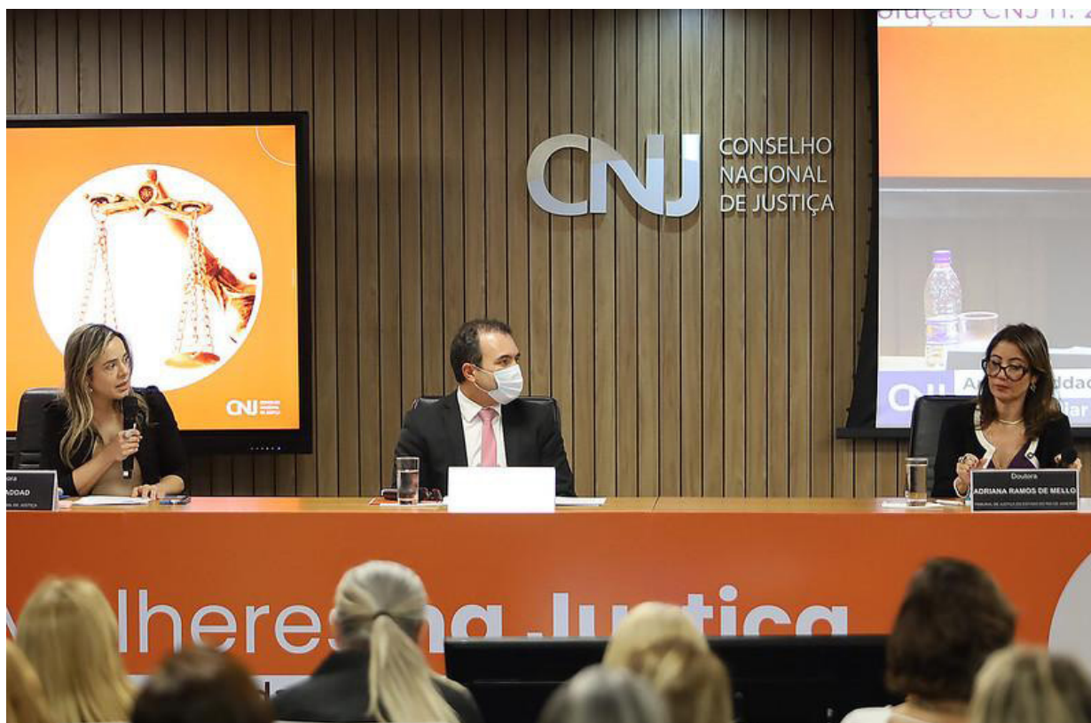
Imagem 3 - Painéis com a participação de integrantes do Núcleo na 1ª edição do evento em 17 de novembro de 2022