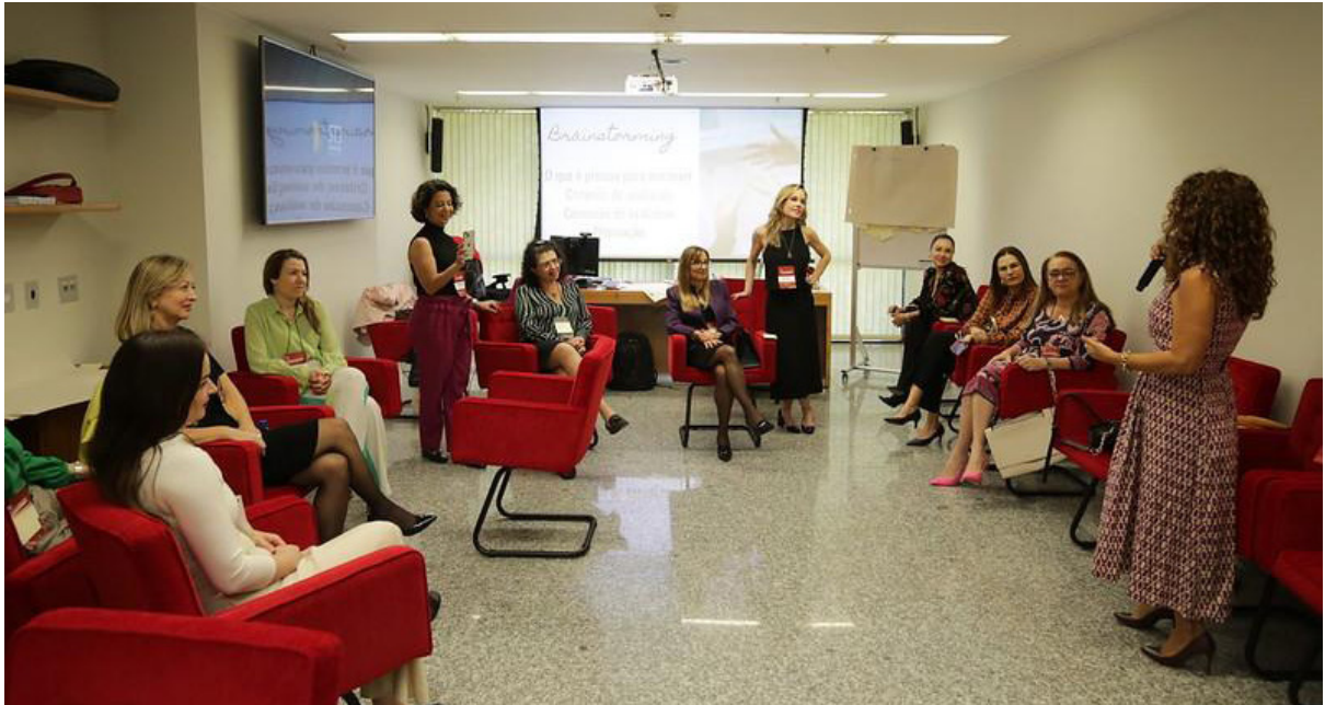
Imagem 7 - Oficinas com a participação de integrantes do Núcleo na 2ª edição do evento entre os dias 30 e 31 de agosto de 2023