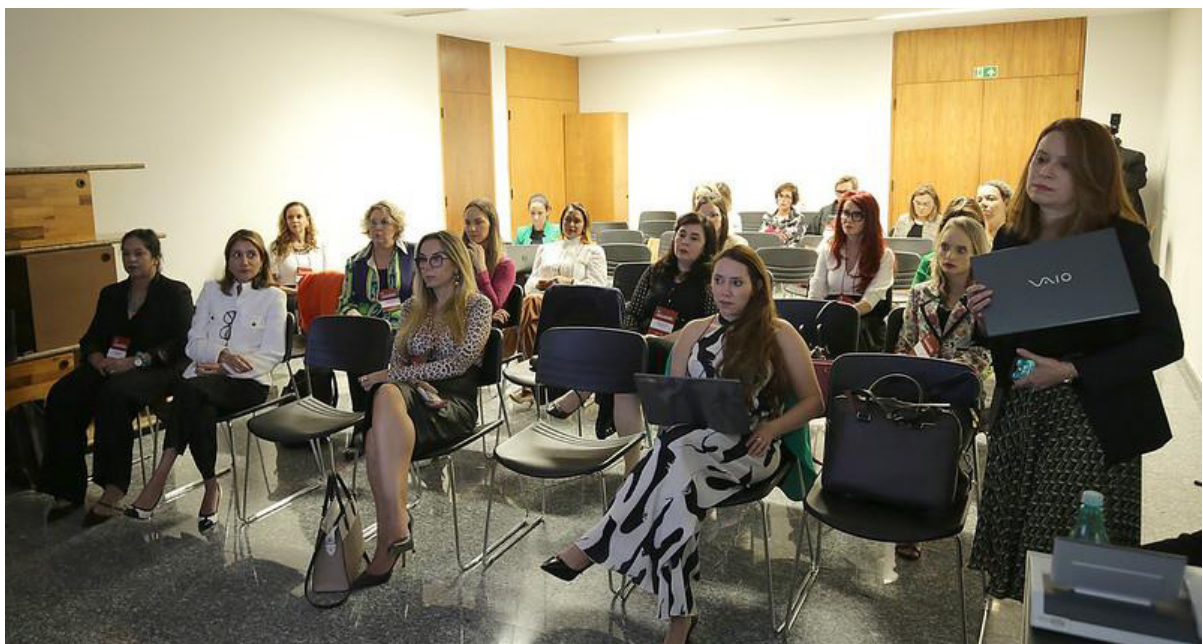
Imagem 8 - Painéis com a participação de integrantes do Núcleo na 2ª edição do evento entre os dias 30 e 31 de agosto de 2023