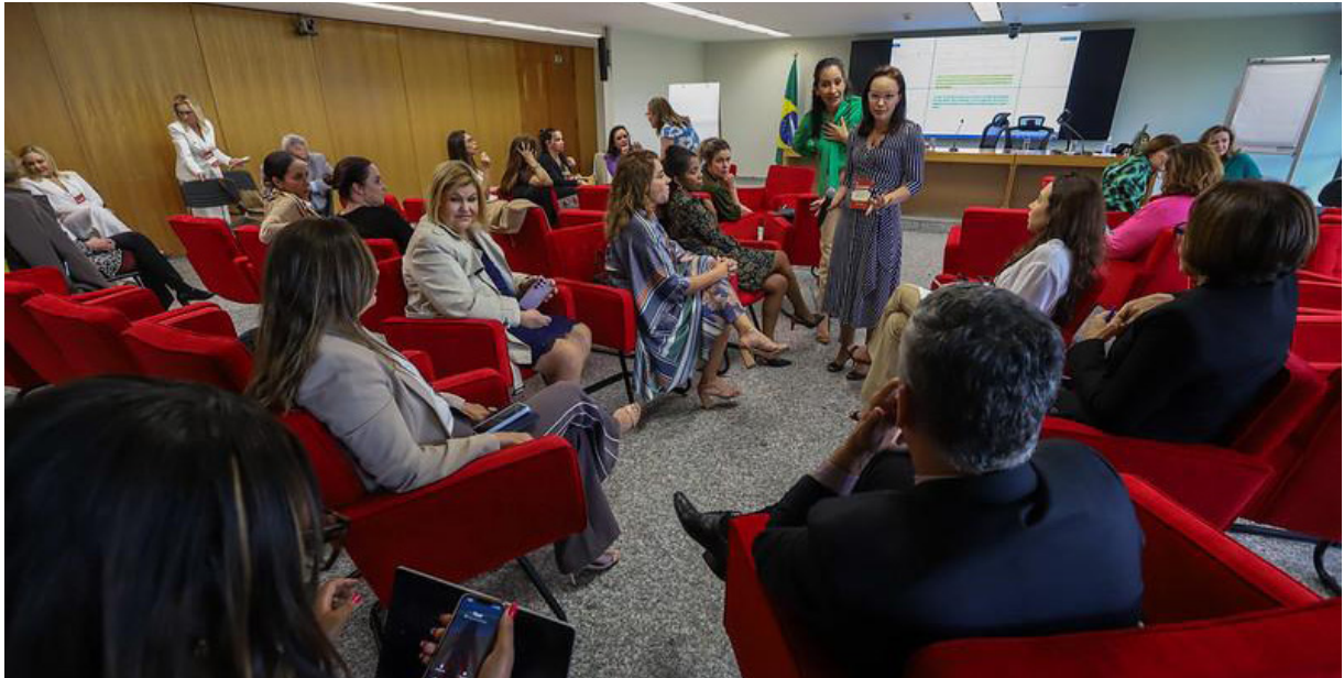
Imagem 11 - Painéis com a participação de integrantes do Núcleo na 2ª edição do evento entre os dias 30 e 31 de agosto de 2023