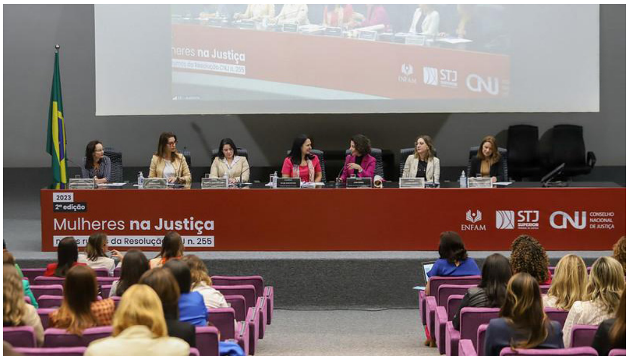
Imagem 12 - Painéis com a participação de integrantes do Núcleo na 2ª edição do evento entre os dias 30 e 31 de agosto de 2023