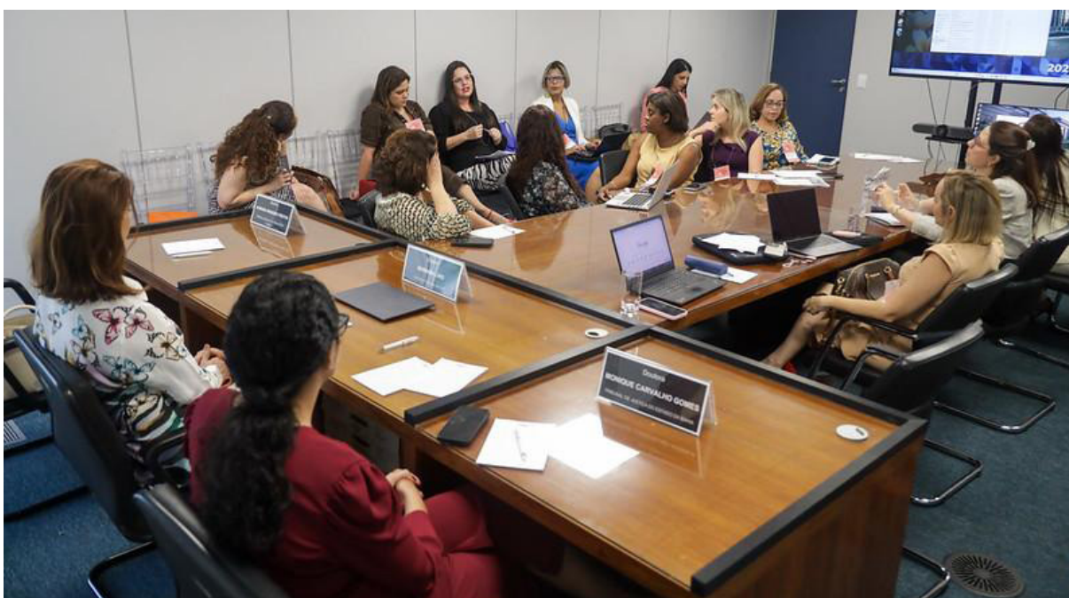
Imagem 21 - Oficinas com a participação de integrantes do Núcleo na 3ª edição do evento entre os dias 12 e 13 de setembro de 2024