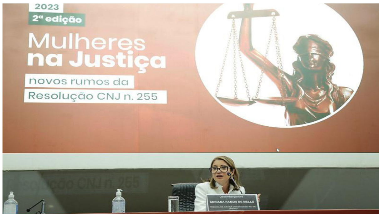
Imagem 9 - Painéis com a participação da líder do Núcleo na 2ª edição do evento entre os dias 30 e 31 de agosto de 2023