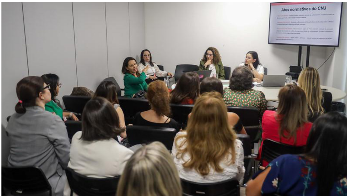
Imagem 19 - Oficinas com a participação de integrantes do Núcleo na 3ª edição do evento entre os dias 12 e 13 de setembro de 2024