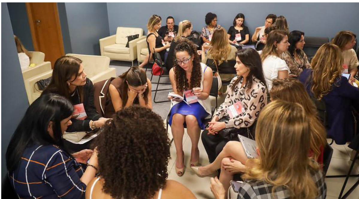
Imagem 20 - Oficinas com a participação de integrantes do Núcleo na 3ª edição do evento entre os dias 12 e 13 de setembro de 2024