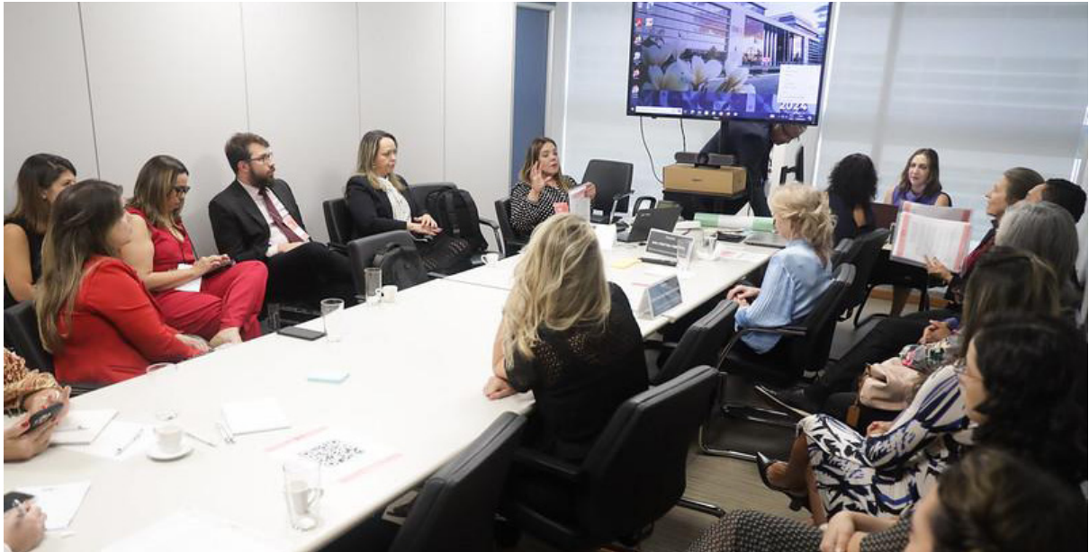
Imagem 18 - Oficinas com a participação de integrantes do Núcleo na 3ª edição do evento entre os dias 12 e 13 de setembro de 2024