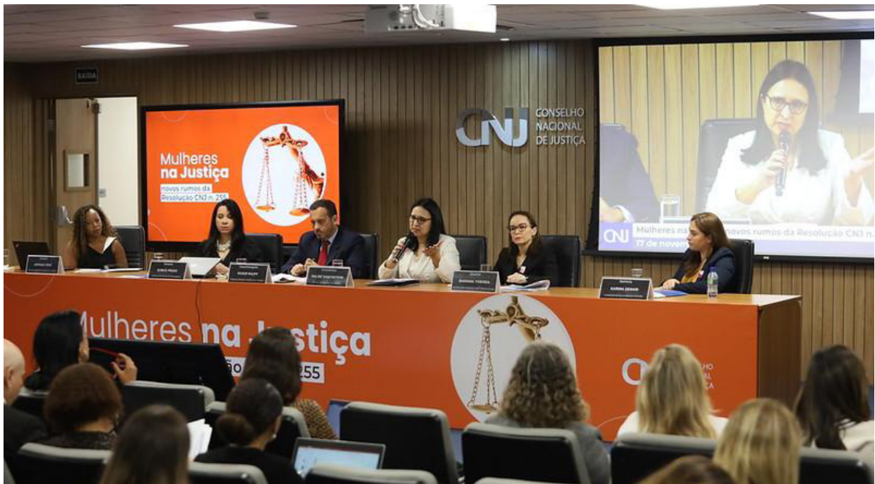
Imagem 2 - Painéis com a participação de integrantes do Núcleo na 1ª edição do evento em 17 de novembro de 2022