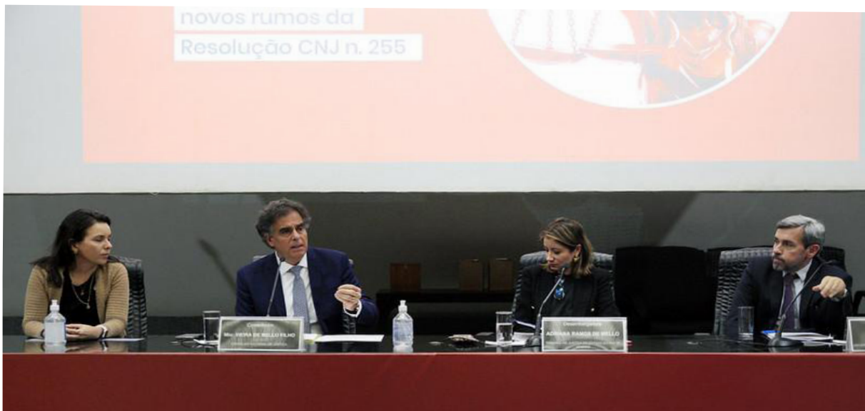
Imagem 4 - Painéis com a participação de integrantes do Núcleo na 2ª edição do evento entre os dias 30 e 31 de agosto de 2023